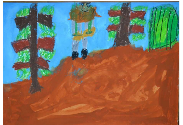
【すぺしゃる たけうま】