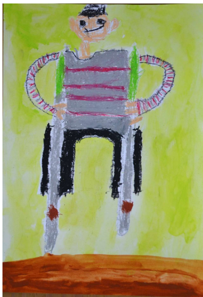
【たけうまでさかみちをのぼって スイカのゴールをめざした!】